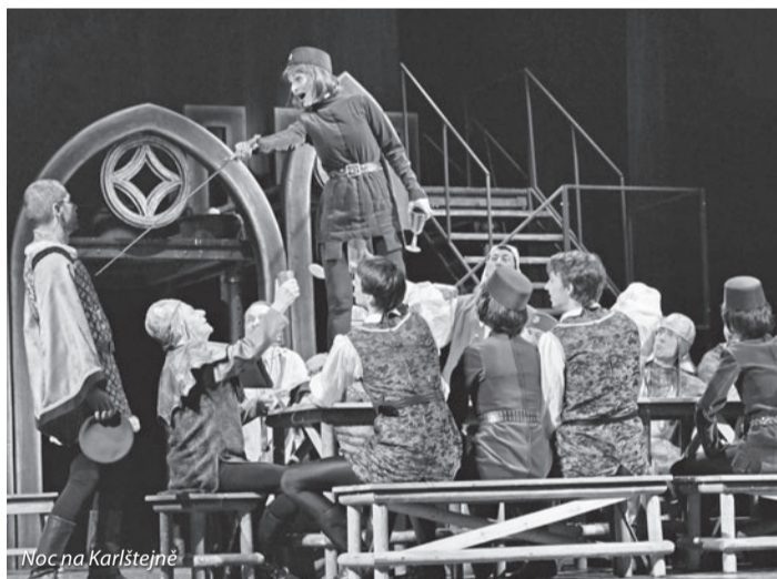
Noc na Karlštejně