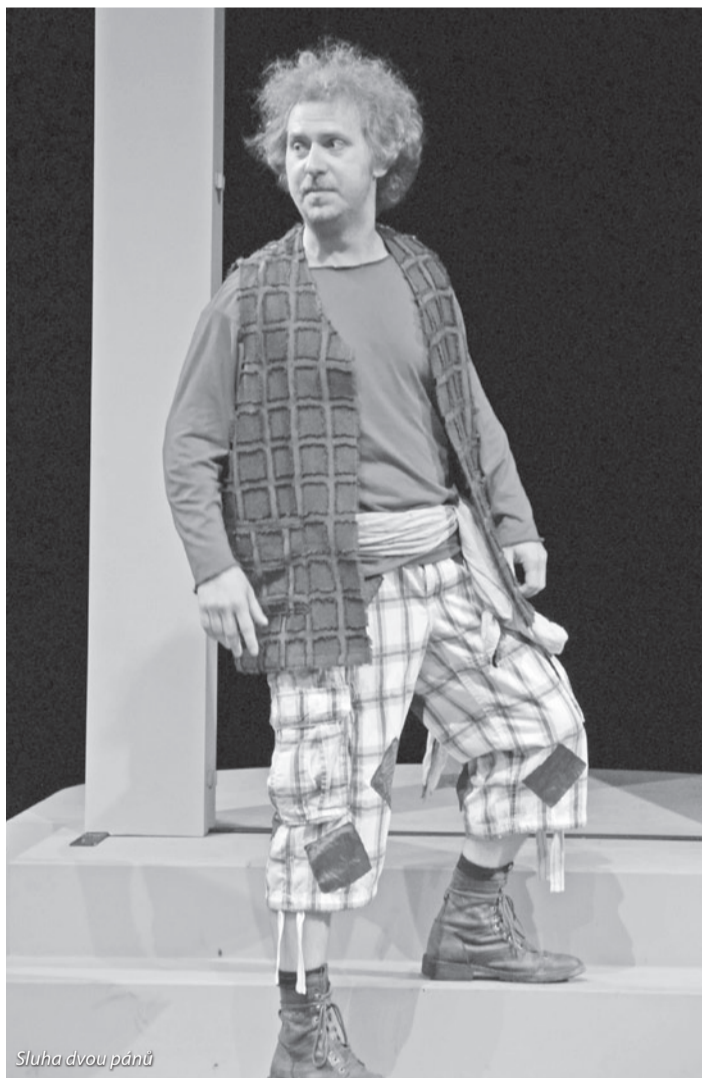
Sluha dvou pánů

Šeherezáda – symfonická suita (35. dílo z roku 1888) z baletu Šeherezáda, která svou opojnou melodickou krásou a instrumentační barvitostí vyniká nad jinými skladbami Rimského-Korsakova. Pestrá instrumentace evokující orientální prostředí s bohatou rytmickou a melodickou invencí s motivy vzdálené exotiky.