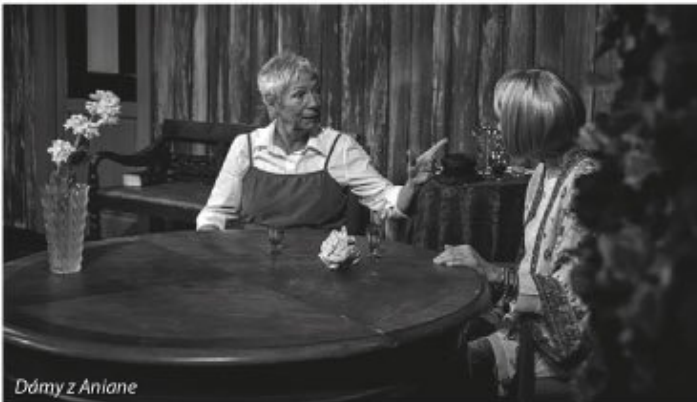
Dámy z Aniane