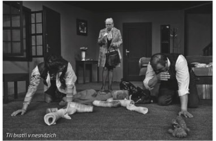
Tři bratři v nesnázích