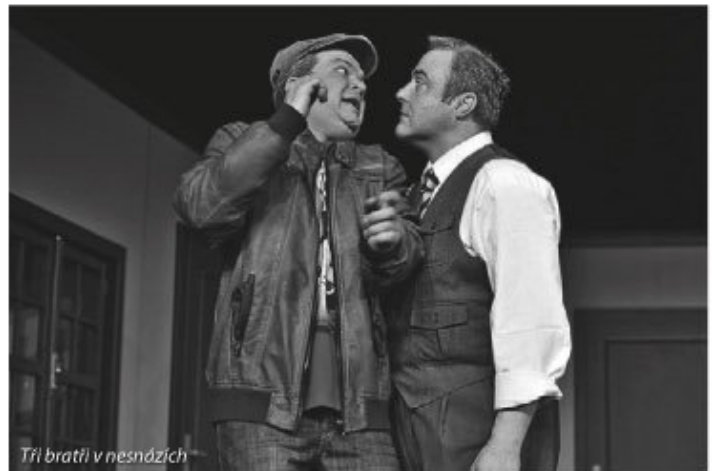
Tři bratři v nesnázích