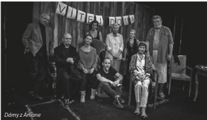
Dámy z Aniane

Dopisoval si a „diskutoval“ tam odtud o politice a filosofii s největšími osobnostmi své doby, jakými byli například Voltaire, Jean – Jacques Rousseau, carevna Kateřina Veliká a další. Byl autorem dvaatřiceti knih, dokonce snad i fantastického románu „Cesta do středu Země“, který mu s velkou pravděpodobností „šlohnul“ Jules Verne. Přesto se dokázal proslavit až svojí autobiografií „Historie mého života“, kterou sepsal právě na Duchcově. A tato Casanova „cesta ke slávě“ bude hlavním motivem našeho komediálně laděného muzikálu.